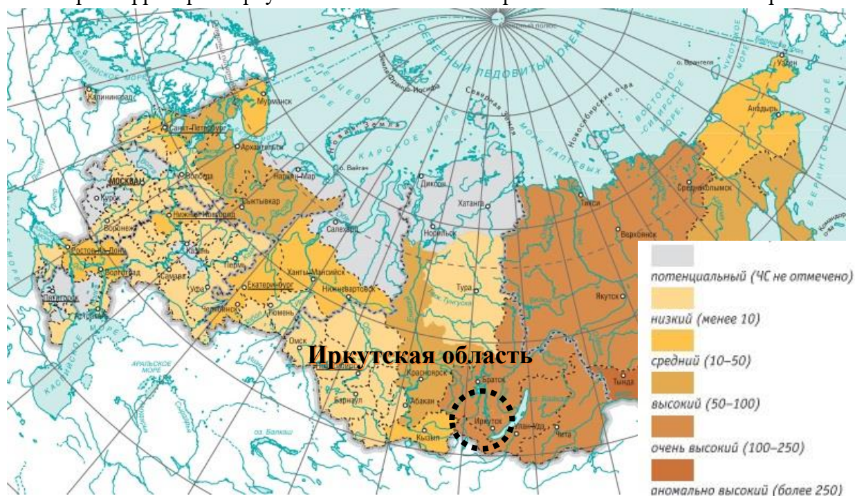
Карта территории Иркутской области с зонами рисков возникновения пожаров